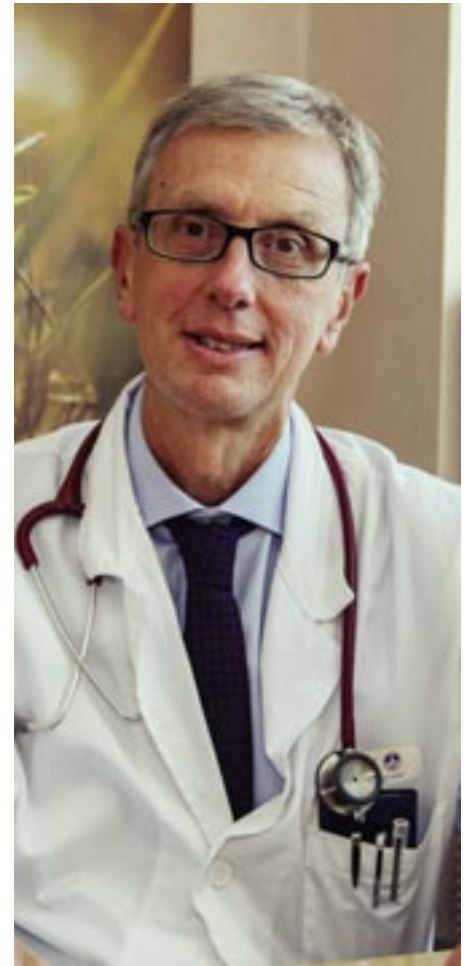
Il professor Giampaolo Tortora

È quella di presidiare sempre più tutti gli ambiti della diagnostica e della terapia, seguendo la traiettoria delle ricerche più avanzate in termini di diagnosi e terapia di precisione.