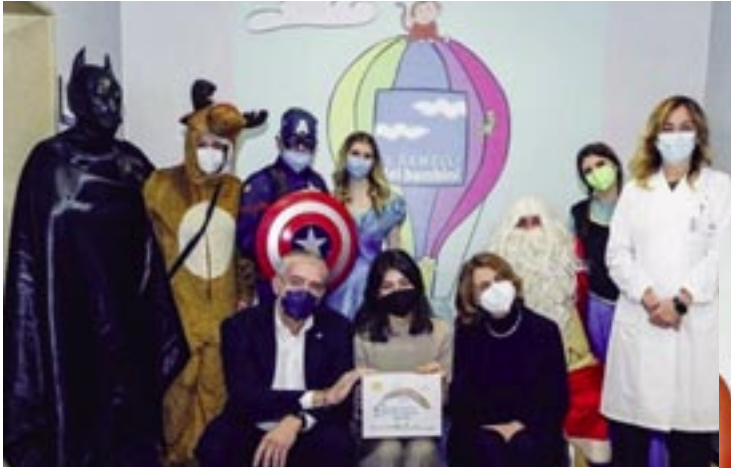
Il 13 dicembre, consegna dei regali sospesi, iniziativa dell'UNICEF Italia e Clementoni giocattoli, con la partecipazione di Alessandra Mastronardi, ambasciatrice UNICEF

Il 21 dicembre, dopo la benedizione del presepe e dell'albero di Natale nella hall del Gemelli, il pomeriggio di festa è proseguito con l'esibizione dei ragazzi dell'Accademia di Musica Suaviter e della Compagnia Teatrale "Diversi da chi", dedicata agli operatori, ai sanitari e ai pazienti dell'ospedale. A seguire "I superheroes Siciliani" (nella foto), hanno fatto visita a tutti i reparti pediatrici portando regali a tutti i piccoli ospiti