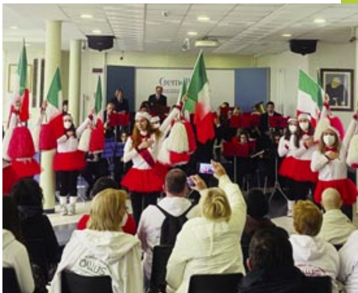
Il 29 dicembre, consegna doni al Centro NeMO Pediatrico e neuropsichiatria infantile da AIDR (Associazione Italian Digital Revolution) con il partner Beat 2020