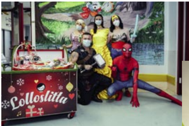
Il 21 dicembre, giornata speciale per i piccoli pazienti del reparto NeMO, grazie ai doni creativi della Fondazione Heal e del pugile campione europeo Aziz Abbes Mouhiidine