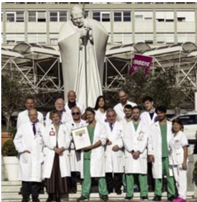
Il team di Radiologia Interventistica del Gemelli

La Fondazione Policlinico Universitario A Gemelli IRCCS rappresenta il terzo centro italiano, l'unico nel centro-sud, ad ottenere tale riconoscimento che la pone a livello dei centri internazionali di riferimento per tali procedure.