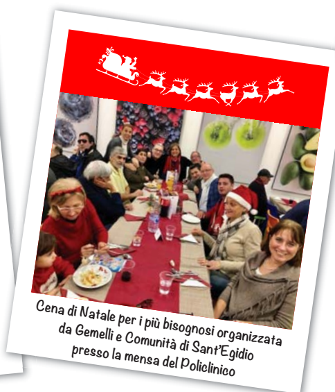
Cena di Natale per i più bisognosi organizzata da Gemelli e Comunità di Sant'Egidio presso la mensa del Policlinico