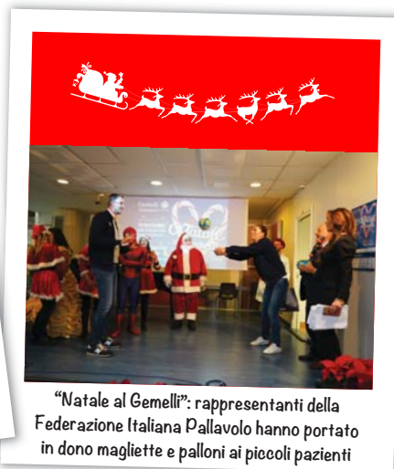
"Natale al Gemelli": rappresentanti della Federazione Italiana Pallavolo hanno portato in dono magliette e palloni ai piccoli pazienti