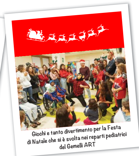
Giochi e tanto divertimento per la Festa di Natale che si è svolta nei reparti pediatrici del Gemelli ART