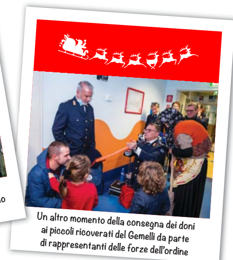
Un altro momento della consegna dei doni ai piccoli ricoverati del Gemelli da parte di rappresentanti delle forze dell'ordine