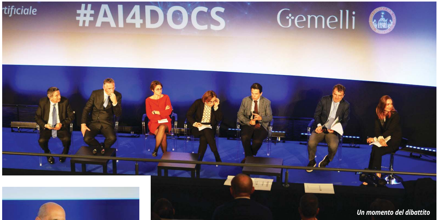
Un momento del dibattito