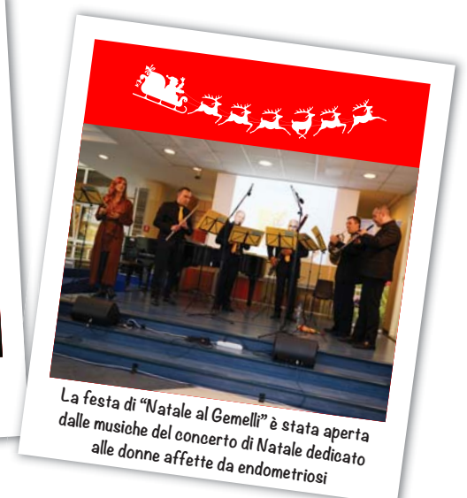
La festa di "Natale al Gemelli" è stata aperta dalle musiche del concerto di Natale dedicato alle donne affette da endometriosi