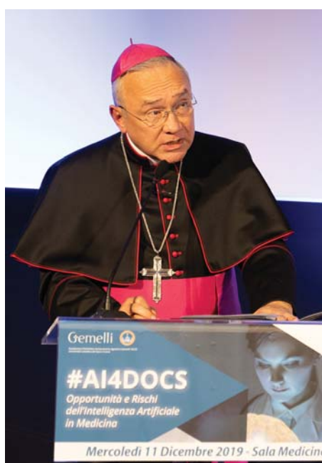
Arcivescovo Edgar Peña Parra