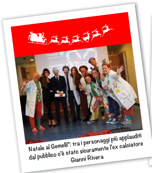
"Natale al Gemelli": tra i personaggi più applauditi dal pubblico c'è stato sicuramente l'ex calciatore Gianni Rivera