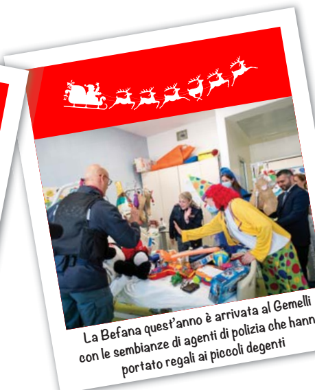
La Befana quest'anno è arrivata al Gemelli con le sembianze di agenti di polizia che hanno portato regali ai piccoli degenti