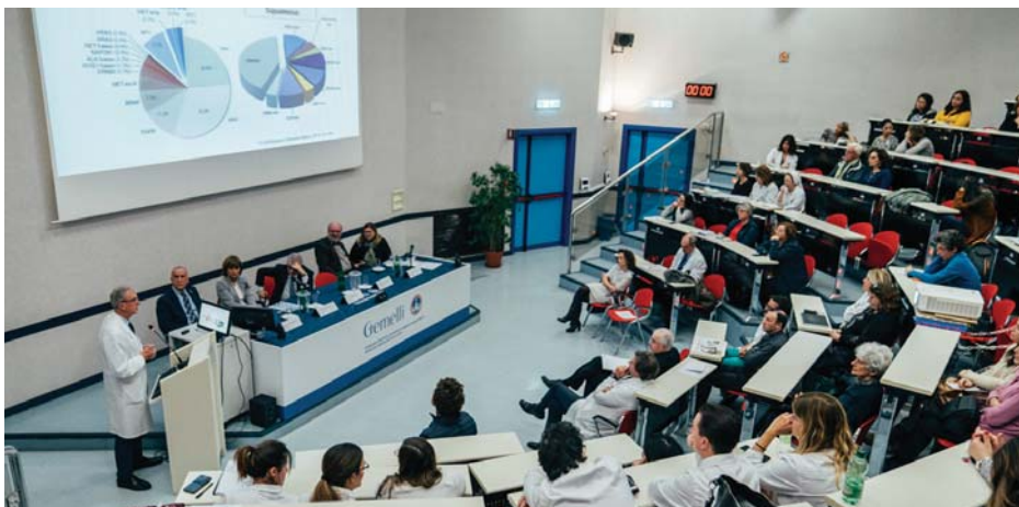
Un momento del convegno "Psiche, corpo, spirito: alleati per la cura" che si è tenuto al Policlinico Gemelli lo scorso 20 novembre

La malattia infatti, è stato spiegato, si configura con diverse gradazioni di intensità e varianti come una situazione di crisi, spesso di crisi acuta, che in alcuni casi, come nelle malattie neoplastiche e in quelle croniche e degenerative, si può tradurre in