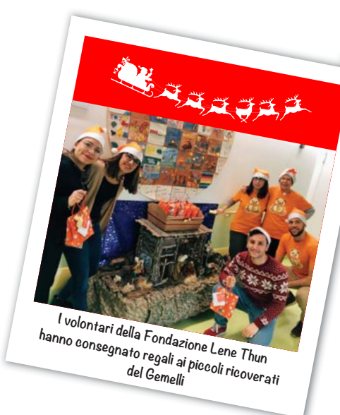
I volontari della Fondazione Lene Thun hanno consegnato regali ai piccoli ricoverati del Gemelli